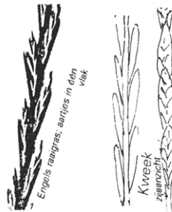
Figuur 6. Aartjes in een vlak of met de brede kant naar de bloeiwijzeas gekeerd (Engels raaigras of Kweek)