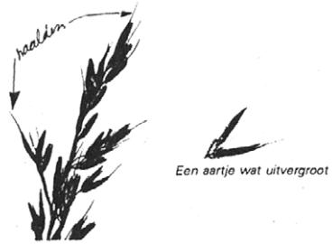
Figuur 5. Naalden aan kafjes