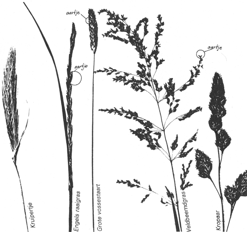
Figuur 8. Enkele veel voorkomende grassen in de Delftse regio.